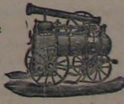
Maquina locomotiv de vapor.