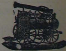
Maquina de vapor locomóvil.