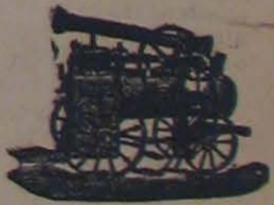
Maquina de vapor locomóvil