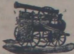
Máquina de vapor locomóvil