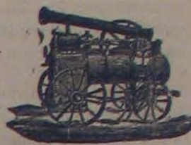
Máquina de vapor locomotiva