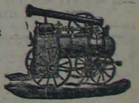
Maquina de vapor locomóvil