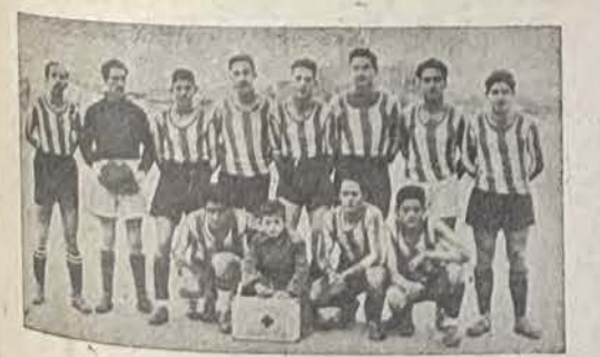
Equipo del C. D. IBARROLA

(XVIII) Durante la existencia del C. D. Medina, se crearon varios clubs modestos que ante la falta de afición, se fueron desmenuzando. De ellos desparecieron algunos jugadores que enrosaron las filas locales; entre estos clubs destacaremos a los entusias-