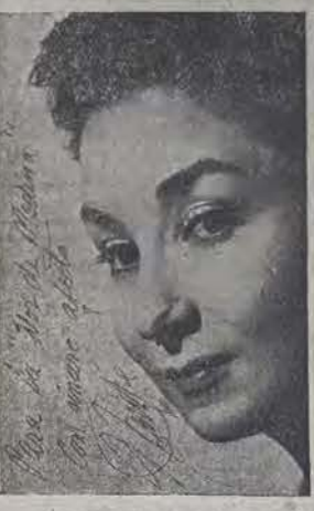
el cuarto día de actuación de la Compañía.

Cada día nos americanizamos más a fondo. Ya en el mundo van desapareciendo las monedas locales y sólo se habla del dólar. Así vemos en los diarios que en Francia la deuda nacional es de mil millones de dólares, y también aquí, en casa, valoramos nuestras cosas en dólares contantes y sonantes. Poderoso caballero, y nada más.