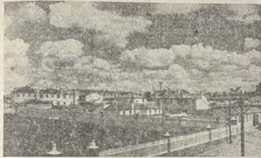
UNA VISTA DEL NUEVO OLMEDO

A las 13, inauguración de la Tombola de Caridad. A continuación en la Plaza del Generalísimo, gran concierto por la Agrupación Musical Olmedana.