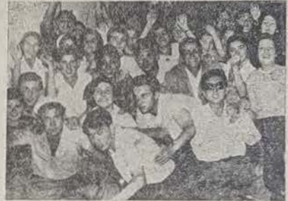
El optimismo se refleja en una de las peñas, "El Rockand Roll"

que pacian en las márgenes del Guadalquivir, en las tranquilas planicies béticas; y partiendo de aquí encontramos a través de los siglos, en nuestra literatura, vestigios de estas fiestas. Las crónicas nos hablan de aquellos bravos caballeros que alanceaban toros, y que son quienes inician este arte, pues arte es desde que el Rey Sabio escribió su "Arte de alancear toros"; esta fiesta continúa a través de los tiempos, prendida en el espíritu del pueblo y alcanza su máximo apogeo en la época de los Austrias. Todos hemos oído hablar de aquellos maravillosos espectáculos, tales como la corrida celebrada con motivo del segundo matrimonio de Felipe II, en la Plaza Mayor de Madrid, donde fueron lidiados 12 toros por la tarde, y 6 por la noche a la luz de las antorchas. Relato de este tiempo es la genial obra, del no menos genial Lope "El Caballero de Olmedo", que tanto atañe a nuestro pueblo.