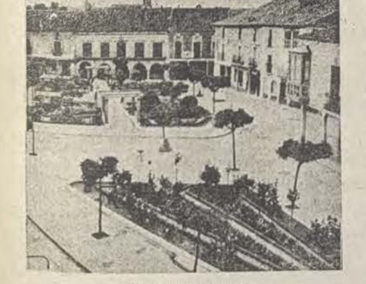
Plaza del Generalísimo