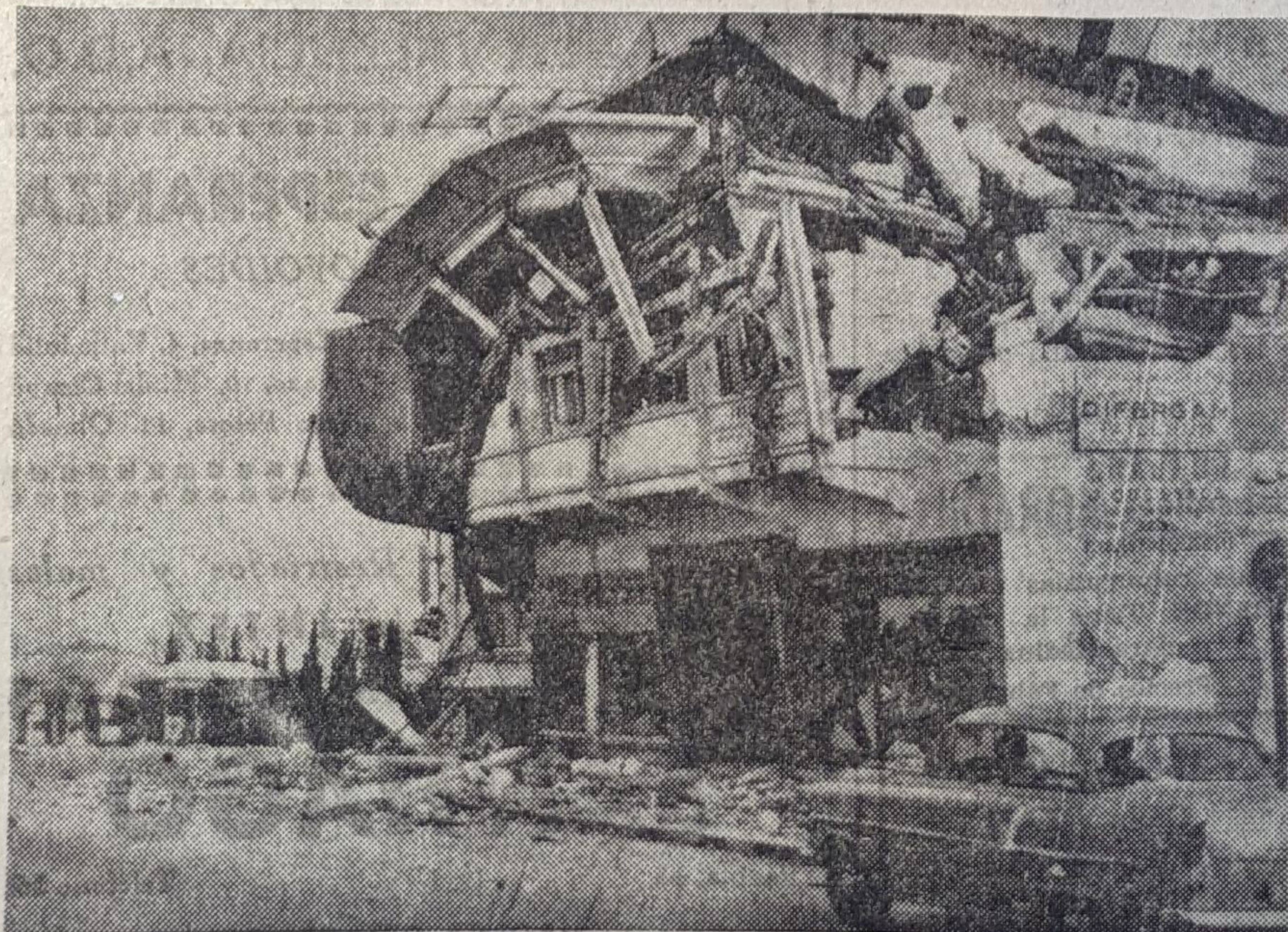
Una de las muchas edificaciones de la martirizada Agadir, destruida por el terremoto