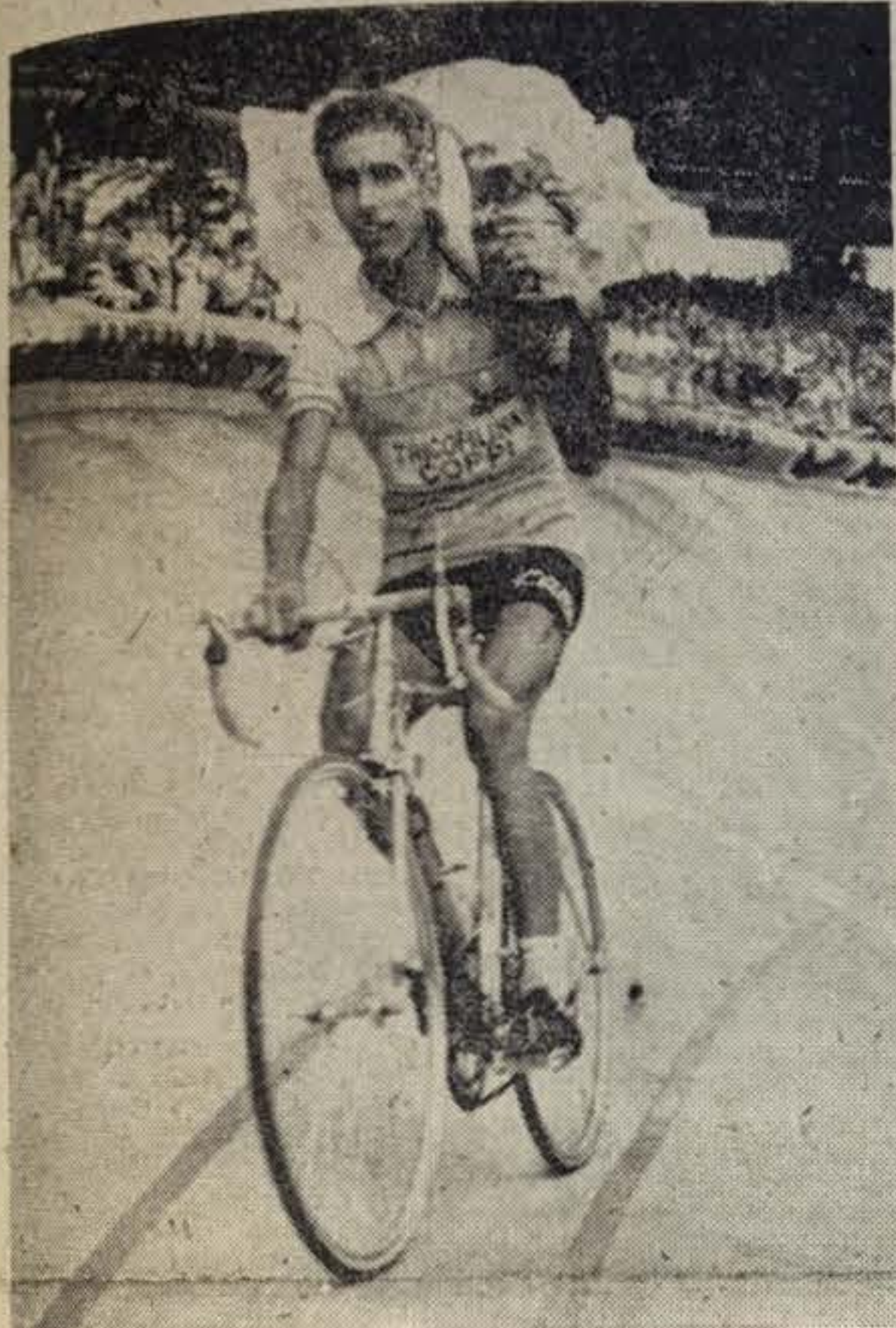
A su llegada triunfal a la capital de Francia vencedor del «Tour», Bahamontes da la vuelta de honor portando un enorme ramo de flores

narías proezas de coloso en el Tour, hacen palidecer no sólo cuantas gestas ha escrito nuestro ciclismo, sino cuanto por España se ha conseguido internacionalmente en todos los ámbitos del deporte profesional, al inscribir su nombre con letras de oro en la lista de la gran ronda mundial.