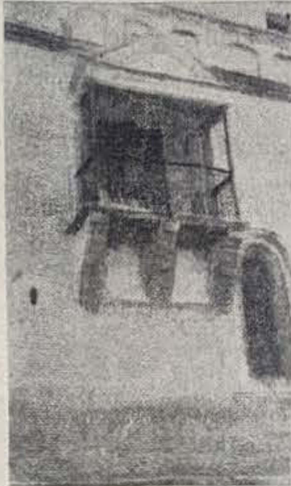
El balcón-altar de la Capilla de Nuestra Señora del Pópulo.