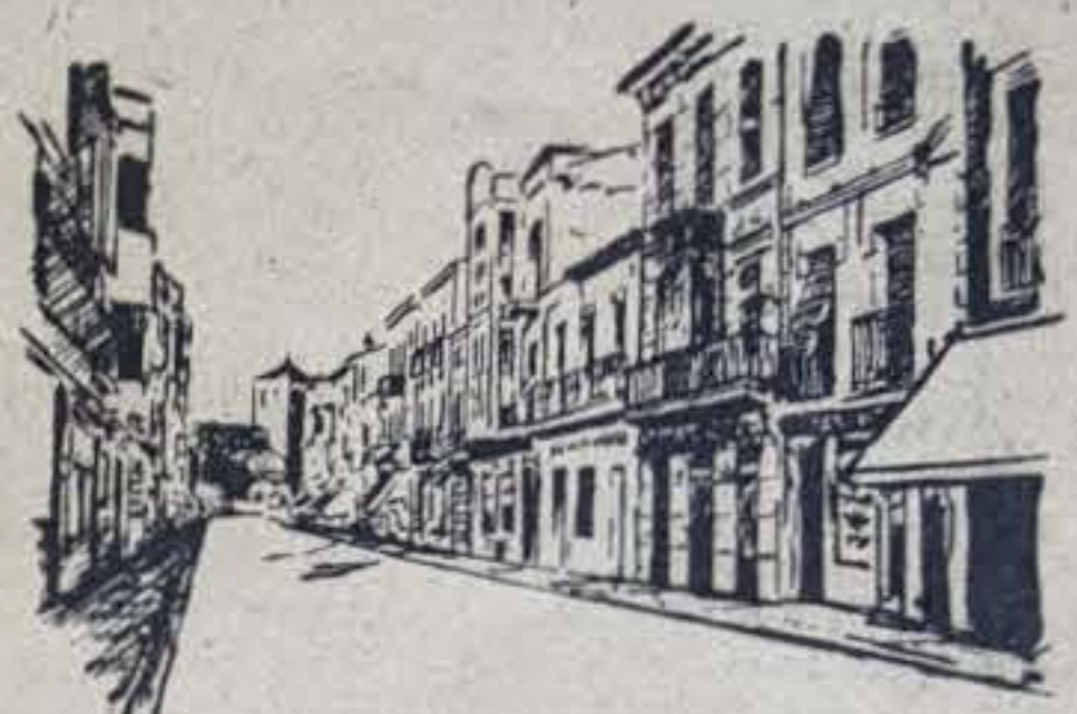
Vista parcial de la calle de Padilla (Apunte de Mariano Alvarez)