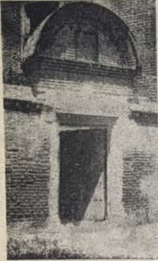
"La Puerta de los Canónigos", entrada a la Sacristía.

Vamos en estas líneas a recapitular, brevisísimamente, sobre lo expuesto en los capítulos precedentes, completando y matizando algunos extremos de lo ya mencionado respecto