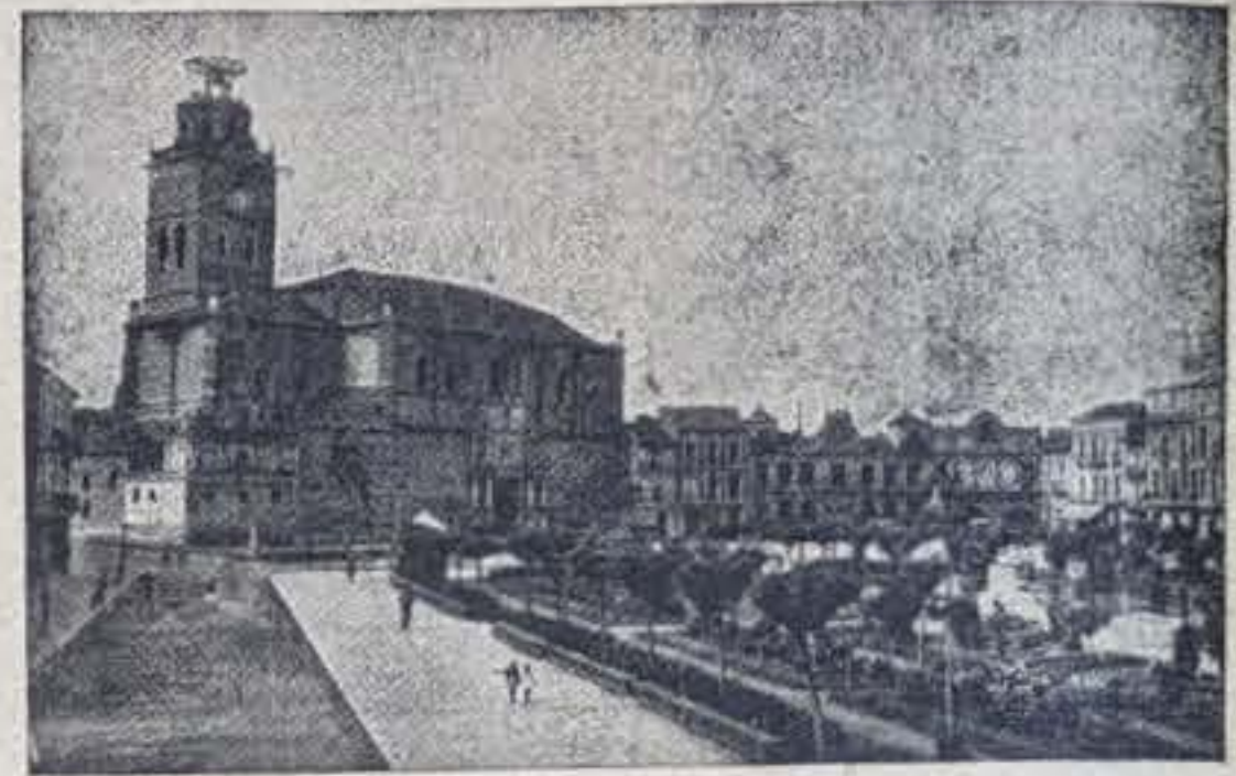
La Plaza Mayor medinense, al fondo, la Colegiata

Quiero, por último, agradecer desde aquí las frases de aliento y estímulo que, por diversos conductos hasta mí han llegado, con motivo de la