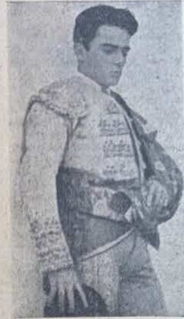
Niño de Tánger

—Sólo quiero reflejar la amistad que nos han brindado a esta Peña Manoletina, desde el titular hasta el último socio, ya que así nos han