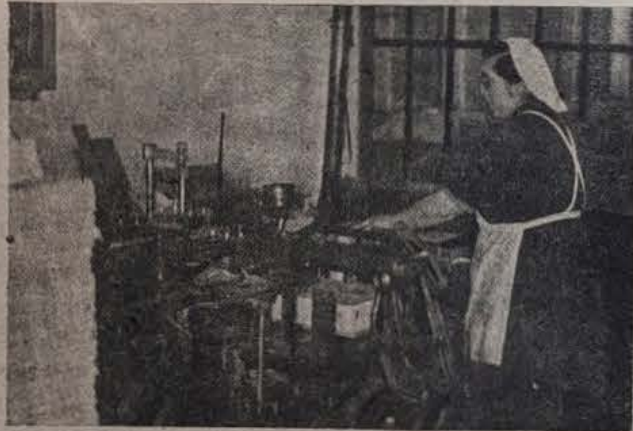
Empaquetado automático.

—me dice—, el cacao tostado, pasa a una limpiadora-descaquilladora y más tarde a