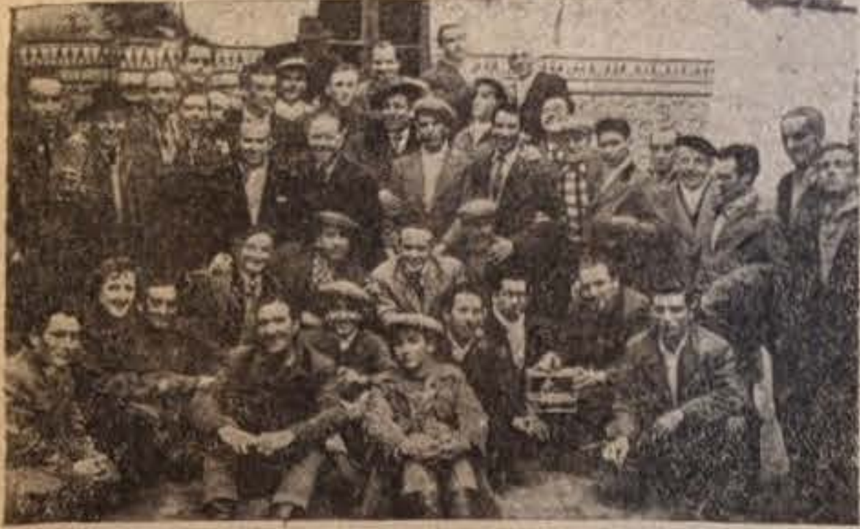
Un grupo de componentes de la Peña Manoletina