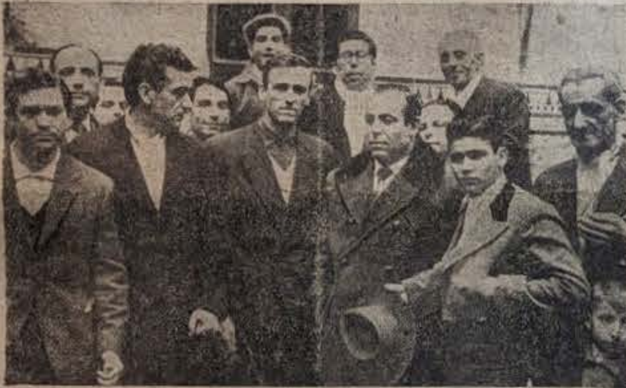
Nuestro diestro, el presidente de la Peña Manoletina y un grupo de aficionados.