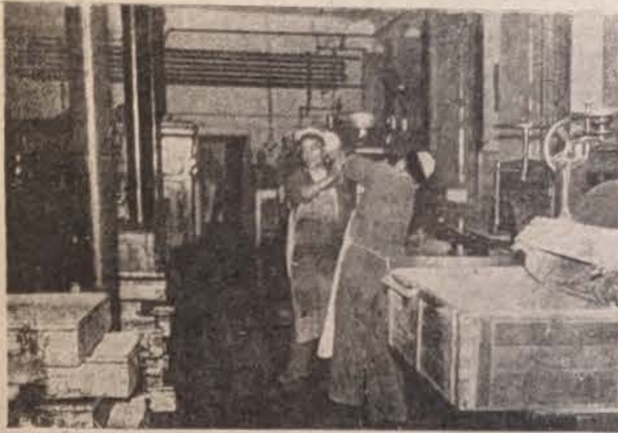
Una de las secciones

Hoy traemos a nuestro semanario otra de las muchas industrias que existen en Medina y que aun no hemos dado a conocer a nuestros lectores.