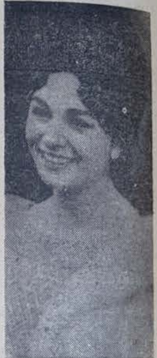
Farah Diba, con el peinado que aludimos

Le tiemblan a uno las carnes pensando en estas catástrofes tan reiteradas. ¿Cuándo van cesar los hombres de buscar la muerte de «motu proprio»? Dejádala, que ella viene cuando nadie la llama.