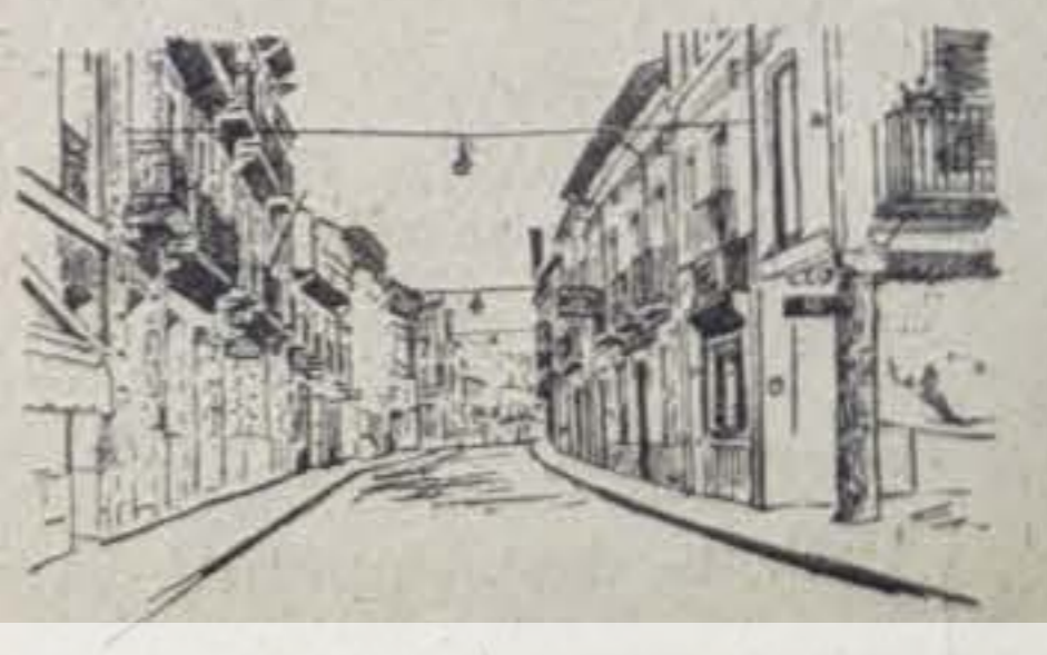
CALLE DE SIMON RUIZ