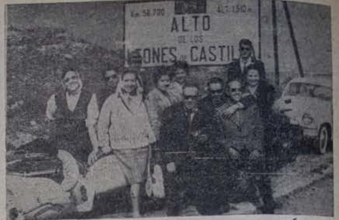
Grupo de medinenses presenciando la subida de los corredores de la Vuelta a España en el Alto de los Leones de Castilla