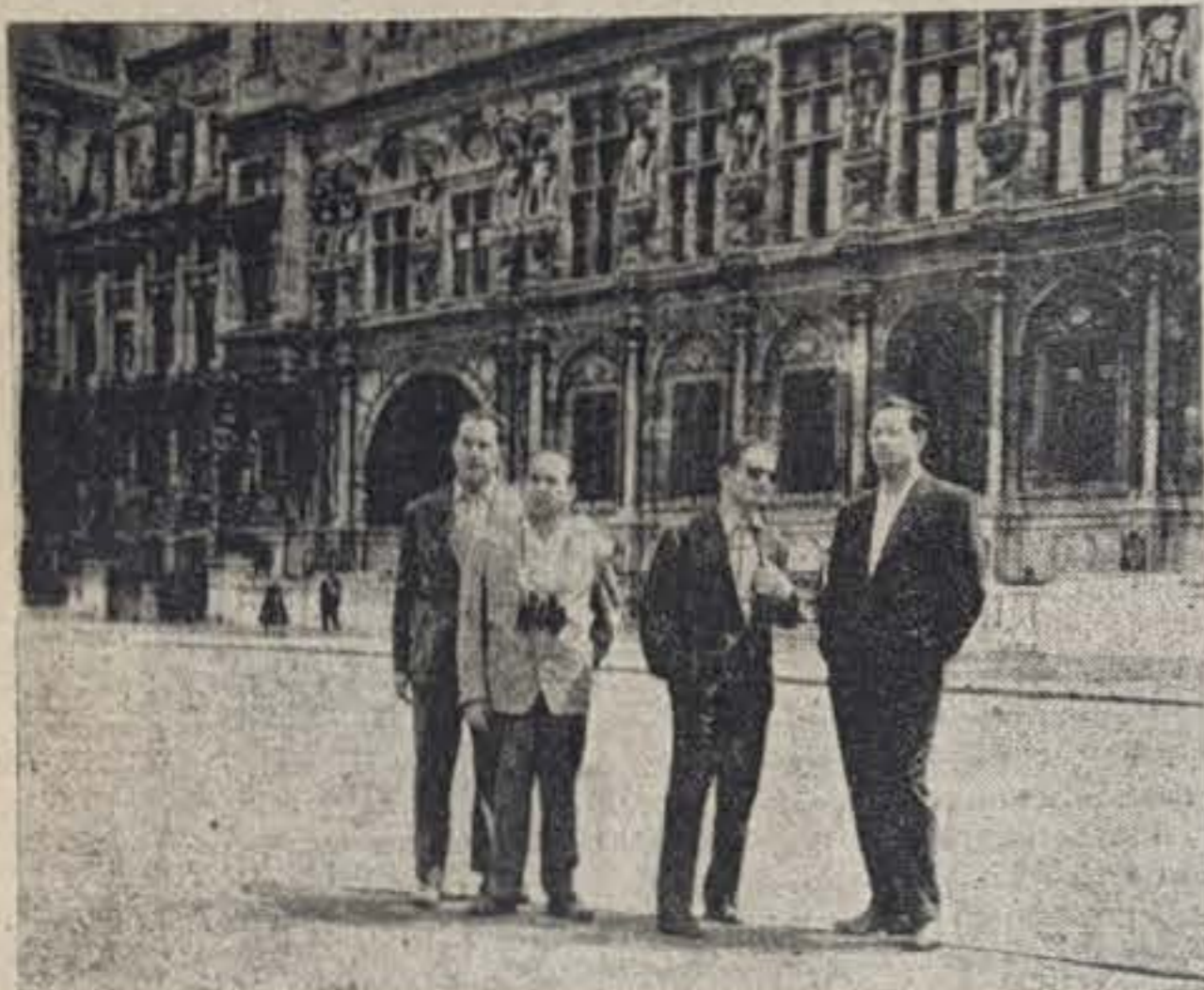
PARIS: Ante el museo de Louvre.

columnas de colores diversos; después, en los otros dos pisos, la fachada se puede decir que es todo cristal y el resto