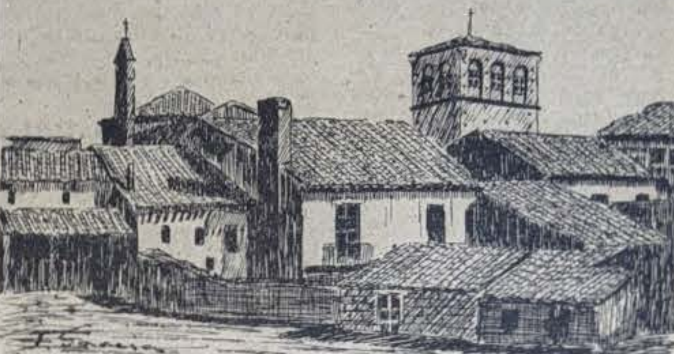
Torreón del Palacio Dueñas e Iglesia conventual de las RR. MM. Carmelitas, desde la Ronda de Santiago. Dibujo de F. García.