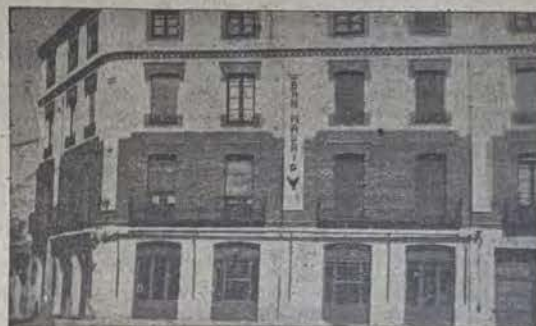
Esquinas de las calles, Once de Febrero y Claudio Moyano