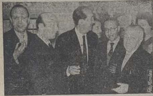
Componentes de ambas Juntas directivas posan para LA VOZ DE MEDINA

ruñés, desde la capital gallega de Coruña se dirigían a Madrid, con el fin de presenciar las corridas que durante estos días se han venido celebrando con motivo de las tradicionales fiestas de San Isidro.