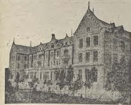
Antiguo Balneario de Medina

No queriendo abusar más de la benevolencia del Padre director LA VOZ DE MEDINA queda agradecida a las facultades, cordial y afabilidad, resumen de los matices de su personalidad, que resultan con viveza en la expresión y fácil manera del diálogo. Agradecemos estas importantes declaraciones, haciendo votos porque esta Congregación que cumple y festeja su centenario, con su fe entusiasmo y espíritu de sacrificio y el lema salesiano "Al trabajo por la alegría" y "La alegría en el trabajo", labor admirable que en Medina fructifiquen su enseñanza, en beneficio de la sociedad que sus proyectos se hagan realidades. Hacemos un llamamiento a las autoridades para que vean manera de arreglar esa carretera que de nuevo toma una vida de gran importancia para la villa.