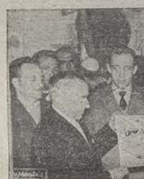
Momento de la entrega del banderín con que el Círculo Taurino Coruñés obsequió a la Peña Taurina "Manolo Blázquez".

años de existencia y con un número inamovible de cien socios y que es hoy por hoy el de más solera taurina de los tres círculos o peñas que existen en la actualidad en Co-