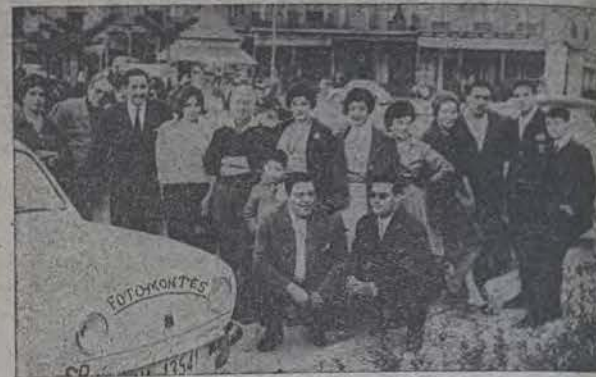
Grupo de participantes del Rallye organizado por el Automóvil Club de Valladolid, a su llegada a nuestra villa.

Todos ellos venían acompañados de sus correspondientes féminas que al apearse de los "bolidos" causaron una agradable expectación en el público.