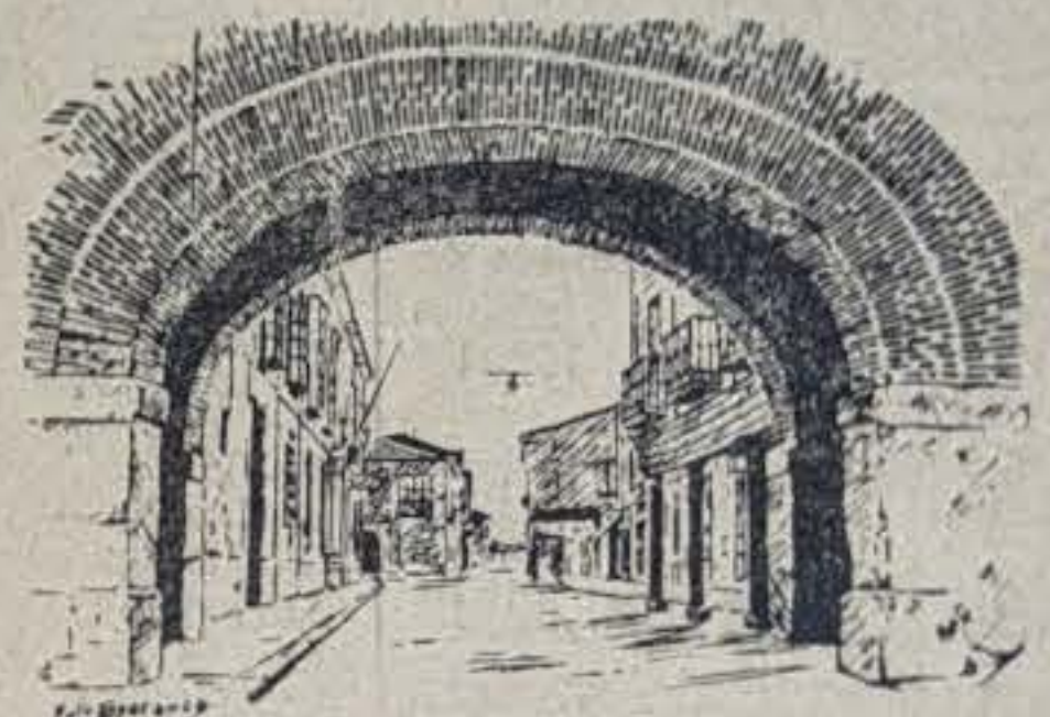
CASA DEL ARCO

Muchos lectores de este semanario, posiblemente desconocen los principios y trascendencia de "nuestras piedras".