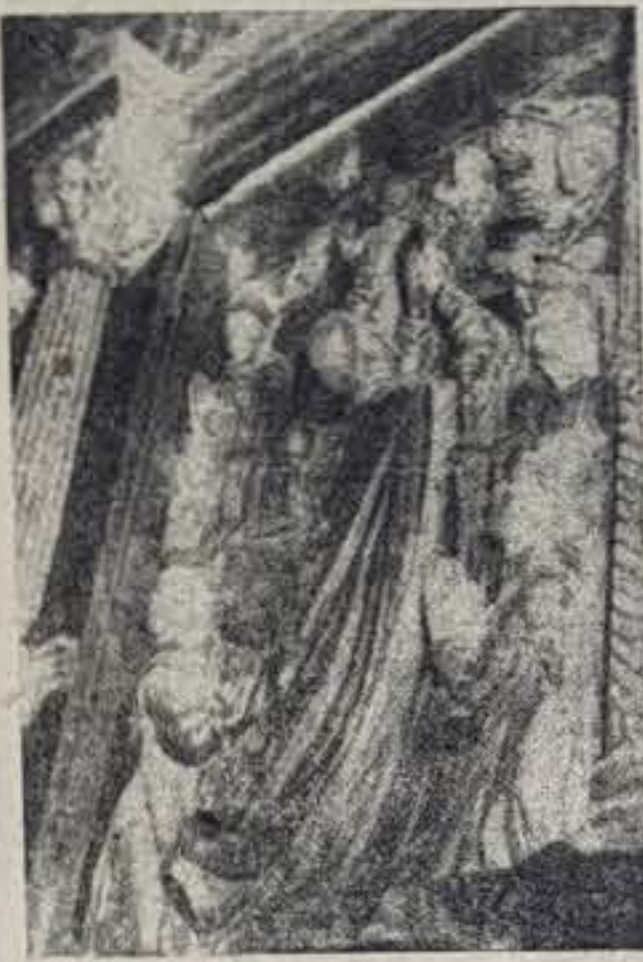
Detalle del relieve central del Retablo de San Gregorio, en la Colegiata.

te superior del Retablo encontramos en talla sobredorada una especie de concha semicircular concava, con temas ornamentales predominantemente geométricos.