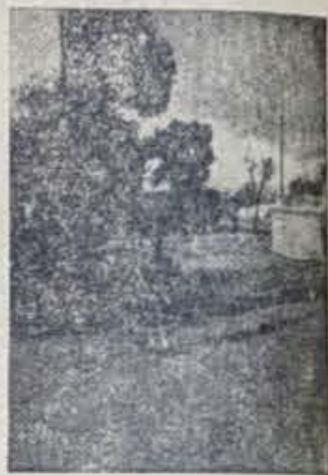
Jardines de Simón Ruiz

en el 1948, por cédula de Alcalá de Henares, se ordenó a Medina la repoblación forestal, confirmada el 15 de septiembre del mismo año, en las ordenanzas municipales de esta