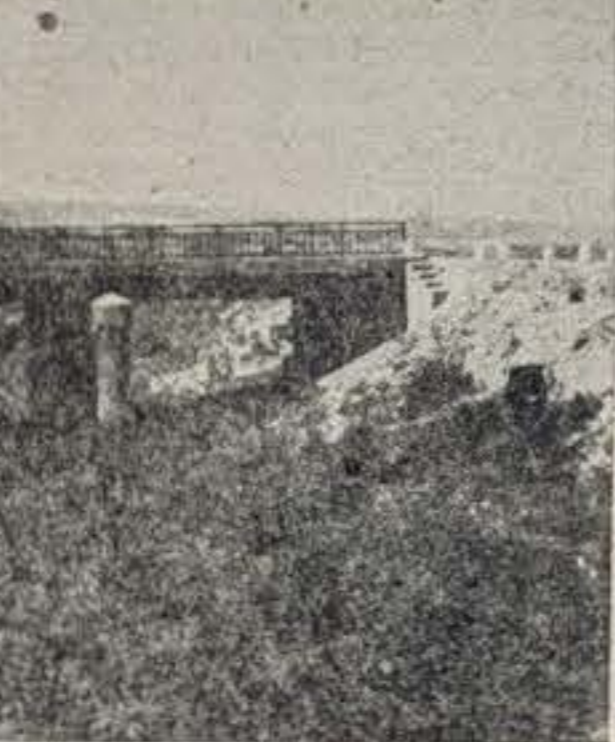
Uno de los pontones que Concentración Parcelaria ha construido sobre el Rio Zapardiel