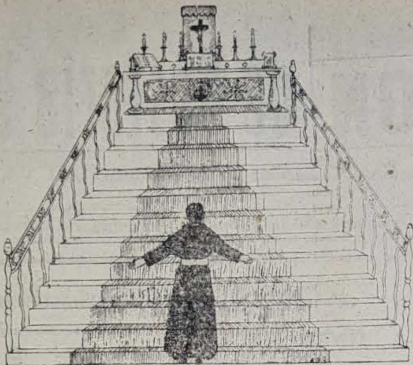
¡Medinense contribuye con un donativo para mantener este semillero de Carmelitas!