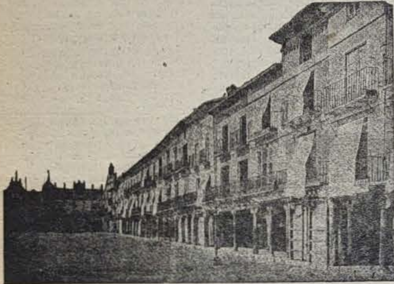
Vista parcial de la acera de la Joyería y la del Sotriño, tomada a finales del siglo pasado. Al fondo, lateralmente se aprecian los restos del antiguo Palacio Real.

lucirían desde el toque de la esquila del Aposentador hasta el de la campana de queda. Asimismo tenían los jueces de la Villa el deber de visitar las instalaciones y examinar si estaban hechas conforme a las referidas Ordenanzas. Concluye este curioso docu-