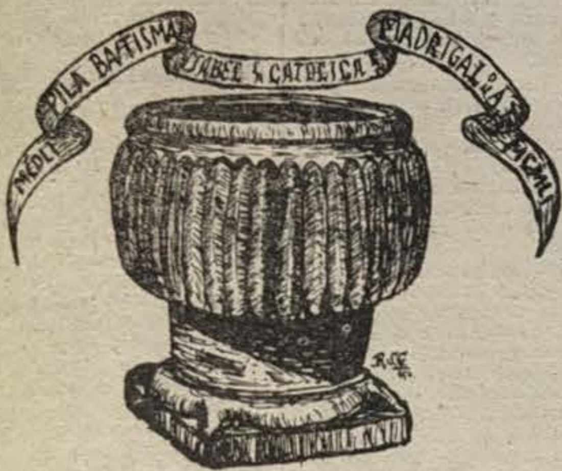
Pila bautismal de la parroquia de San Nicolás, de Madrigal de las Altas Torres, donde recibió el bautismo la Reina Católica.

njó en Madrigal de las Altas Torres, no es verdad indubitada.