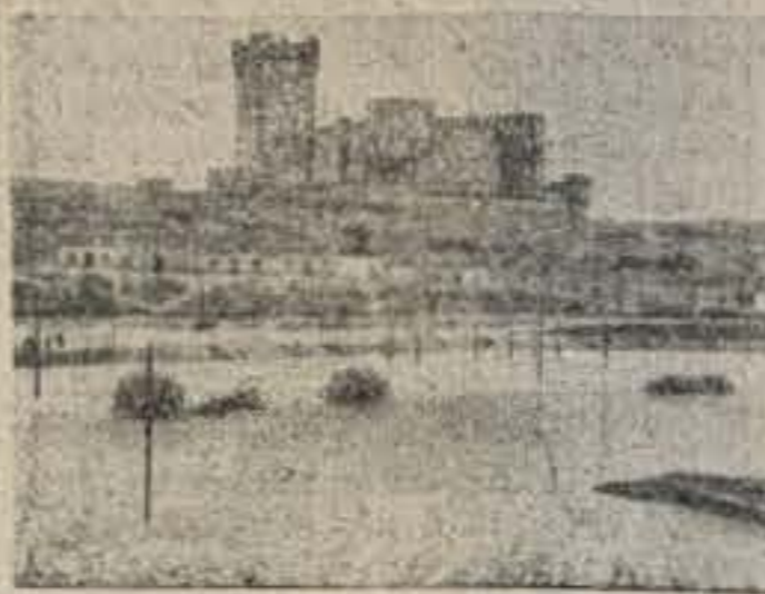
Aspecto de nuestro «humild» aprendiz de río, visto desde la Avenida de López de Vega