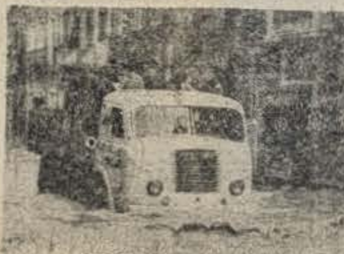
La calle de Padilla, con una nueva y motorizada V. nueva, en la mañana del Viernes Santo de 1956