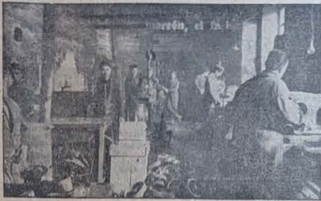
Aspecto de una nave de trabajo.

Montada en Medina en el año 1947 con el nombre de FUNDICION Y TALLERES BARRIO, razón social que posteriormente, y a la muerte