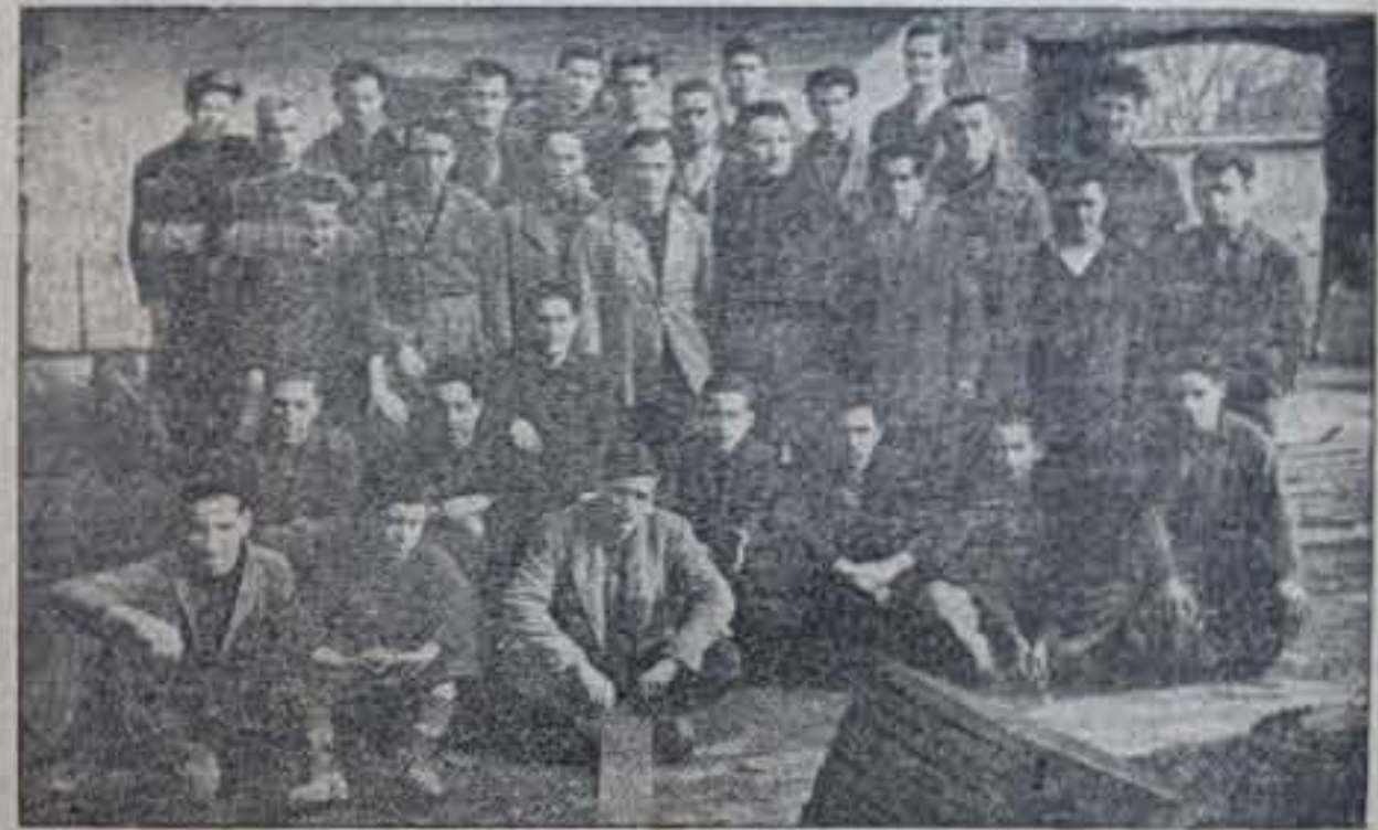
Propietario y obreros posan para LA VOZ DE MEDINA.

Su maquinaria ha sido presentada en el mercado nacional en varias ferias y certámenes, habiendo recibido muchos premios, entre los que destacan el Título de Expositor de Honor en la III Feria