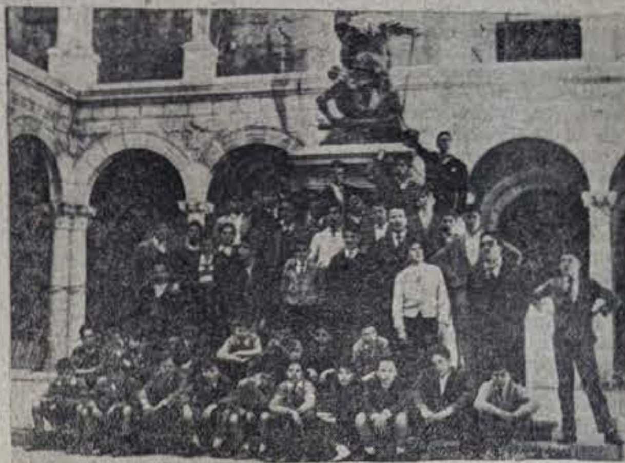
Grupo de alumnos del Colegio Cervantes, durante su visita al Alcázar de Toledo