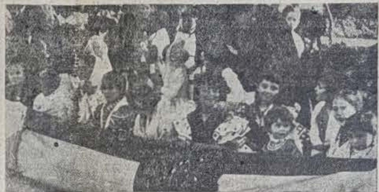
Grupos de bellísimas señoritas que presidieron la corrida

El pasado domingo, día 10 de mayo, tuvo lugar, en el Colegio de San José de las Hijas de Jesús, una serie de actos en conmemoración de la «Fiesta de la Primavera». Asistió a estos actos nuestra primera autoridad acompañada de su esposa, y gran número de padres de alumnos de este modelo de Colegio. La organización merece especial mención, ya que constituyó un triunfo rotundo para las Hijas de Jesús. Numerosos puestos ambulantes existían dentro del amplio campo de deportes del Colegio, en los cuales se vendían toda clase de artículos y de «golosinas». La entrada fue completa. Pero pasemos a comentar en que consistió esta fiesta.